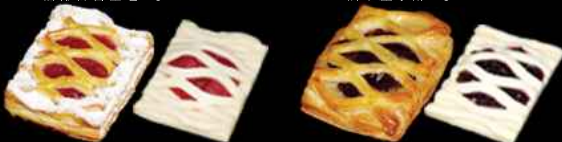
FR228 Mini Strawberry Rhubarb Lattice 40gr ⓘ 細草莓苧莢酥 40gr