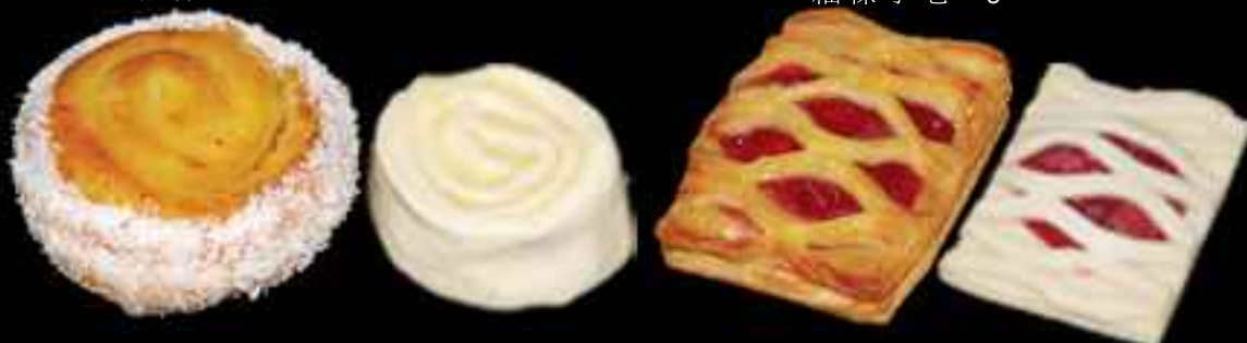
FR223 Mini Pastry Cream Coconut Snail 38gr ⓘ 細椰絲吉士卷 38gr