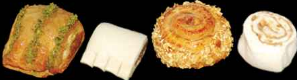
FR211 Mini Bear Claw 40gr ⓘ 細榛子酥 40gr